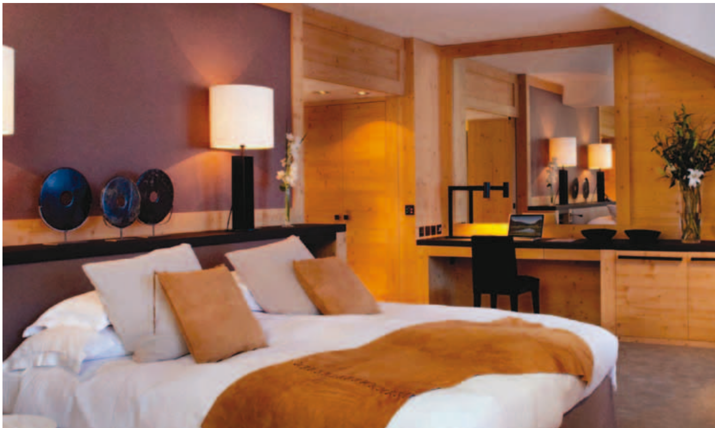
Architecte: Herbert Gnaeggi, Gstaad – Concept Federica Palacios Design, Genève – Maîtrise d'œuvre Wider SA Lausanne, Crissier